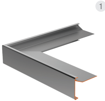
Außenwinkel 300 x 300 mm