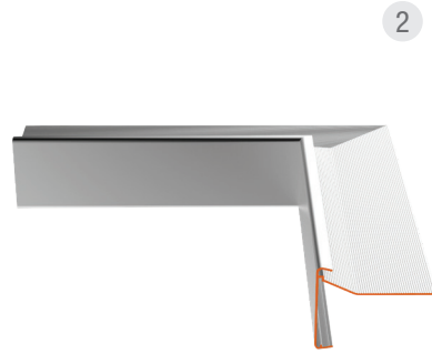
Innenwinkel 300 x 300 mm