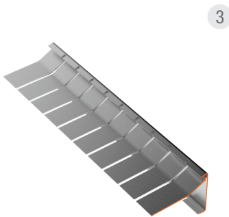
Detail eingesägt für Bögen